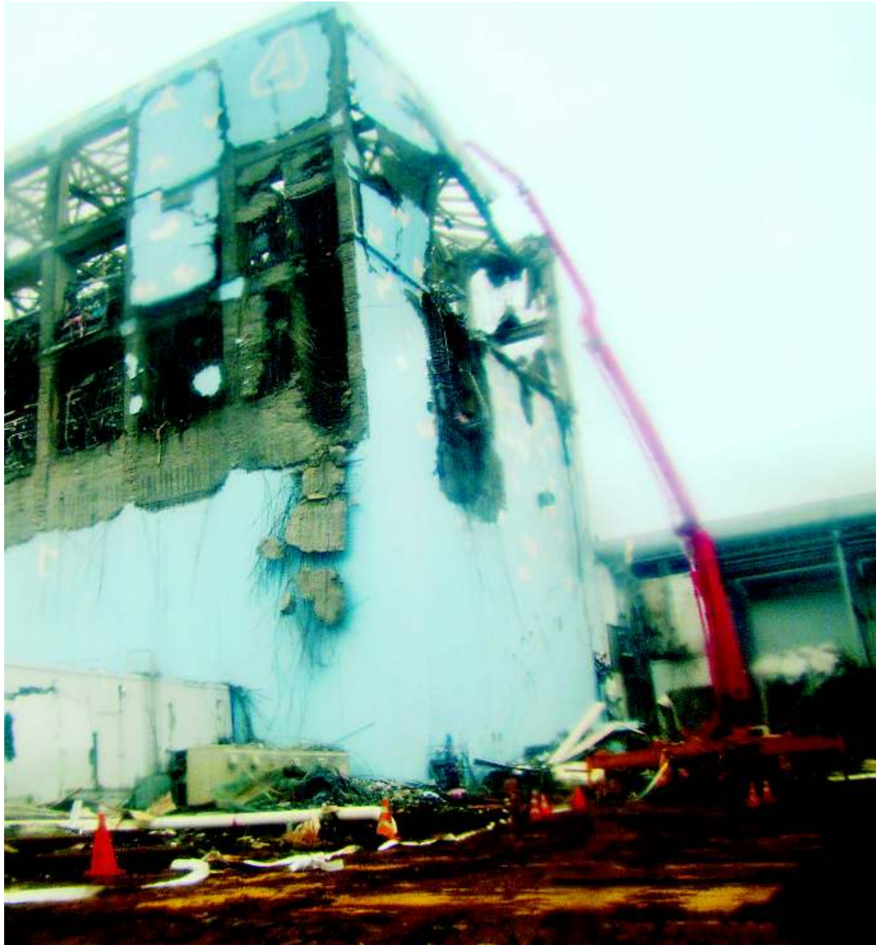
Mit Hilfe der auf 58 Meter ausfahrbaren Pumpe versucht man, die Brennstäbe im Fukushima-Reaktor 4 zu kühlen.

In Birma bauten die Profis und weitere 5000 Arbeiter das gigantische Wasserkraftwerk von Yeywa, allein der 197 Meter hohe Staudamm besteht aus 2,8 Millionen Kubikmeter Beton. Die Sutong-Brücke über den Jangtsekiang, mit 8200 Meter die längste Schrägseilbrücke der Welt, wurde mit Putzmeistermaschinen errichtet. Für den Nagoya-Airport in Japan förderten schwäbische Mammutpumpen neun Millionen Kubikmeter Meeresschlamm an den Tag und schütteten damit 470 Hektar neues Land auf. Der Bau der Eisenbahnverbindung Golmud-Lhasas von China nach Tibet war auch eine Putzmeister-Leistung. Für den mehr als 1000 Kilometer langen Gleisbau auf dem Dach der Welt mussten 286 Brücken und Tunnel gebaut werden. Nebenbei