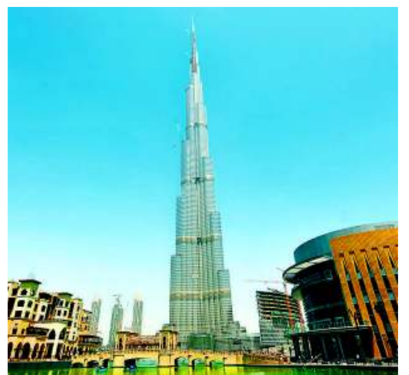
Auf allen Kontinenten im Einsatz: Putzmeister baute die Brücke am Hoover Staudamm, betonierte den Tschernobylreaktor zu und errichtete Burj Khalifa, das höchste Gebäude der Welt, in Dubai.